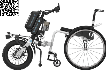
ICON 60 avec PAWS