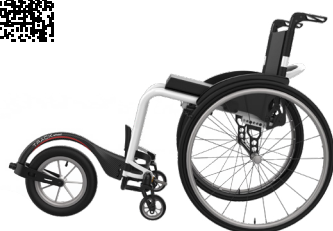
ICON 60 avec TRACK WHEEL